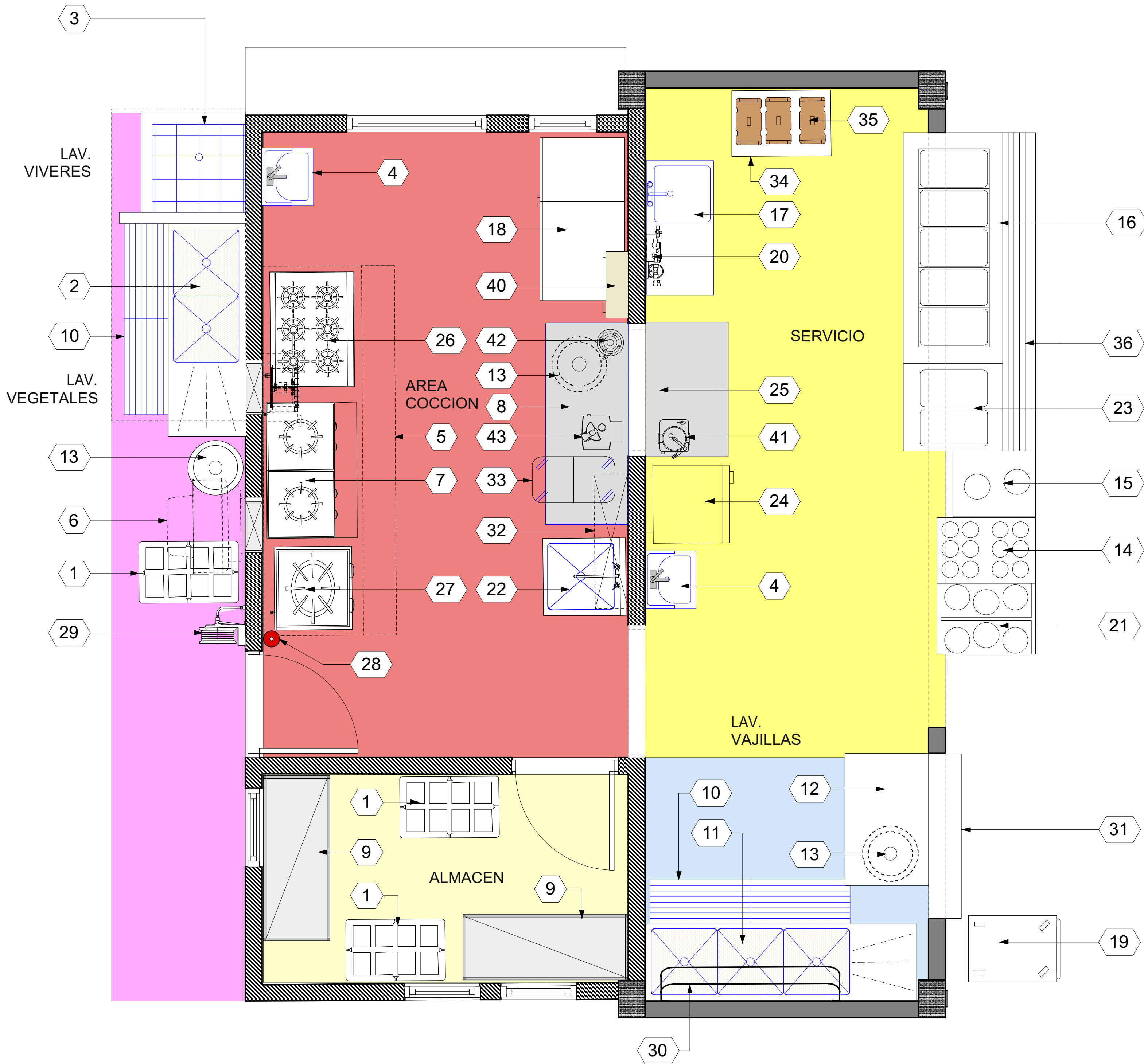
1 DISTRIBUCION EQUIPOS DE COCINA COMEDOR Scale: 1:25