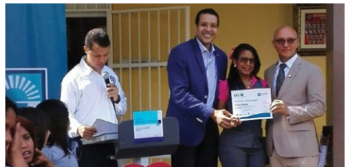
Graduación Politécnico San Ignacio de Loyola