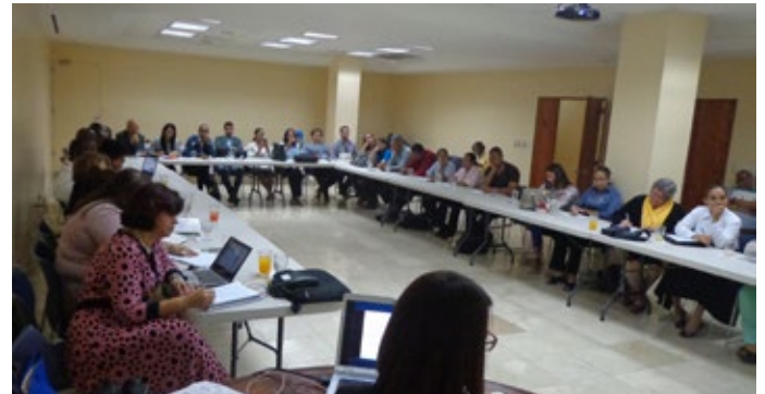
Webinar de Inducción para inicio autoevaluación

Ya se cumplió con la etapa de preparación donde se conformaron los equipos compuestos por personas de diversas áreas que conocen profundamente las prácticas y los procesos a evaluar como proveedores de servicios. En estos momentos se está llevando a cabo la etapa de aplicación de la herramienta y el desarrollo de los Planes de Mejora, actividad a cargo de IYF.