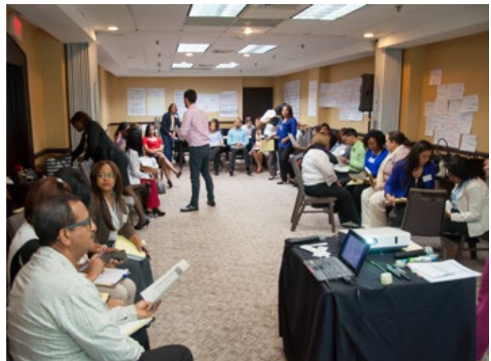
Taller de Intermediación Laboral

Es importante destacar que IYF fue fundada en el 1990, y está comprometida a preparar a la juventud mundial para vivir una vida productiva, saludable y comprometida. Sus programas impulsan el cambio a través de apoyo a jóvenes vulnerables con el fin de que obtengan educación de calidad, adquieran las habilidades necesarias para tener acceso a empleos dignos y realicen cambios positivos en sus comunidades.