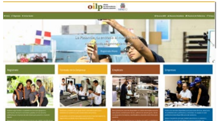
Vista del portal Oficinas de Intermediación Laboral y Pasantías

5) El portal de Gestión de Servicios para las Oficinas de Intermediación Laboral y Pasantías, ya está listo y aprobado por las distintas instancias que se han vinculado para su desarrollo. En estos momentos se está instalando en todas las OILP's para iniciar los trabajos de vinculación externa y de pasantía a través de esta herramienta.