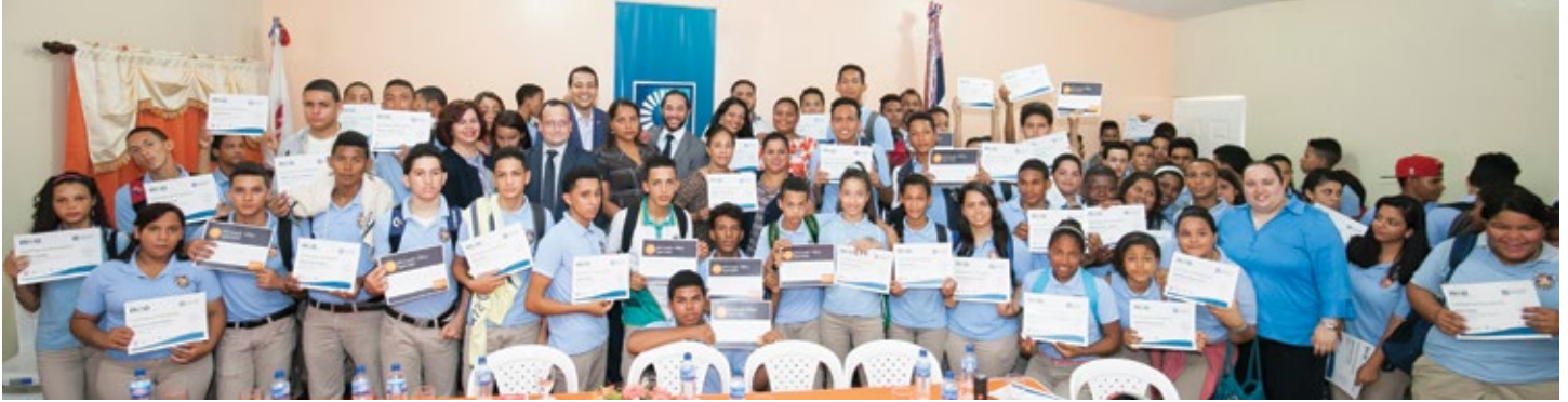
Graduación Politécnico Manuel Acevedo Serrano

7,105 jóvenes (Politécnicos y COS) se graduaron en la capacitación ofrecida a través del Programa NEO.