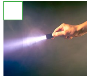
Una linterna encendida