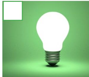
Luz de bombillo