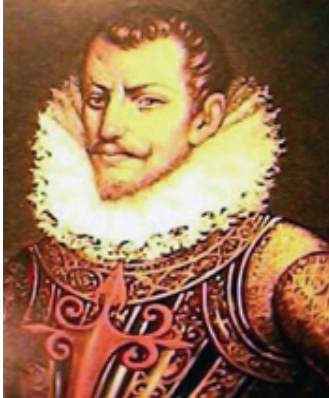
Pedro de Alvarado.