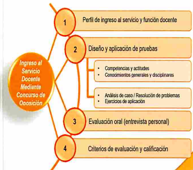
Figura 2: Componentes del Proceso de Ingreso Selectivo al Servicio Docente mediante Concurso de Oposición

Los Estándares junto con el currículo constituyen la base para el diseño y elaboración de técnicas e instrumentos para evaluar los/las postulantes a cargos docentes. Son clave para la preparación y aplicación de pruebas de competencias y actitudes, conocimientos y desempeño, incluyendo ejercicios de aplicación (análisis de casos, prácticas de planificación) y entrevista personal oral. Como instrumento para impulsar la carrera docente, aportan rigurosidad y transparencia a este segundo tramo de la carrera y contribuye a establecer la confianza en el proceso aplicable para la diversidad de cargos en que se utiliza. Dentro de esta perspectiva, se presentan en la Figura 1 los componentes que configuran el proceso de ingreso selectivo al servicio y función docente.