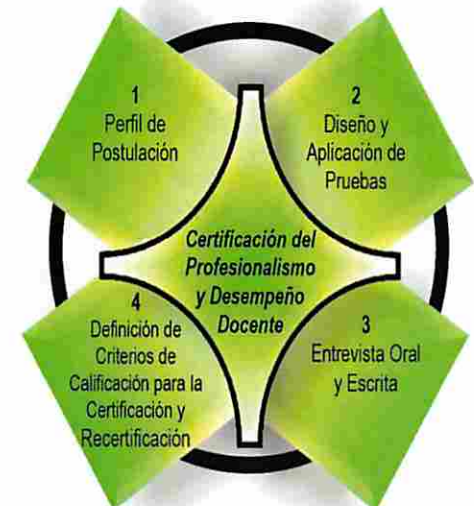
Figura 2: Componentes del Proceso de Certificación del Profesionalismo y Desempeño Docente

La utilidad y el uso de Estándares en la Certificación Docente, en términos operativos su aplicación se enfoca en los siguientes componentes de este proceso: