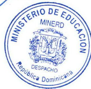
ANDRÉS NAVARRO GARCÍA Ministro de Educación

Dada en la ciudad de Santo Domingo de Guzmán, Distrito Nacional, capital de la República Dominicana, a los veinticuatro (24) días del mes de marzo del año dos mil dieciocho (2018).