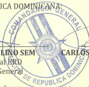
CARLOS ALBERTO AMARANTE BARET Ministro de Educación