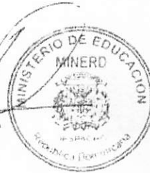
ANDRÉS NAVARRO GARCÍA Ministro de Educación

Dada en el Distrito Nacional, República Dominicana, a los veintiún (21) días del mes de septiembre del año dos mil dieciséis (2016).